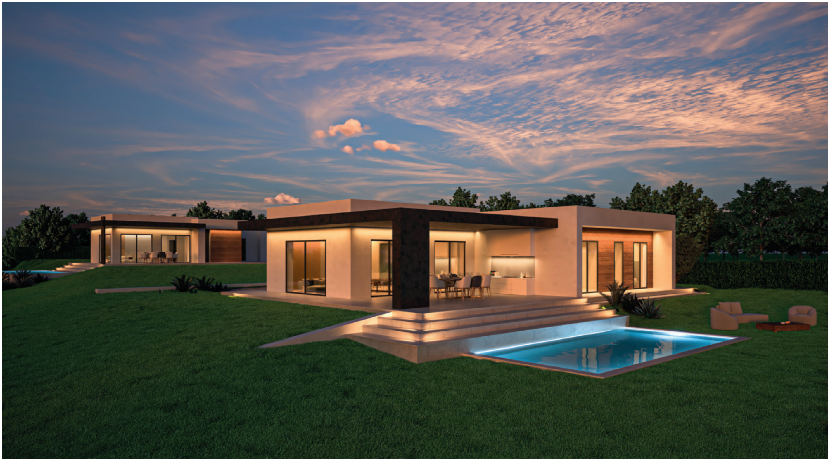
le Evillas di Soiano del Lago e Padenghe sul Garda