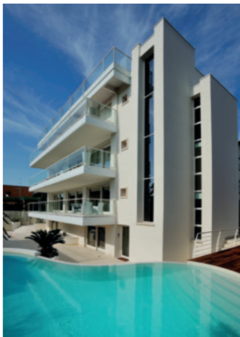
Palazzo Grigolli a Desenzano del Garda

Come si sviluppa un progetto? Condivido insieme all'architetto Vighini ogni singolo passo di un progetto.